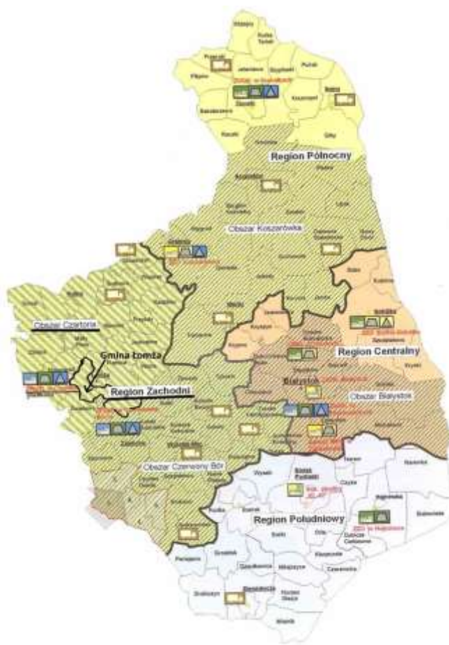
Rys. nr. 1. Podział Województwa podlaskiego na regiony gospodarki odpadami oraz regionalne instalacje przetwarzania odpadów komunalnych wraz z instalacjami przewidzianymi do zastępczej obsługi regionów.